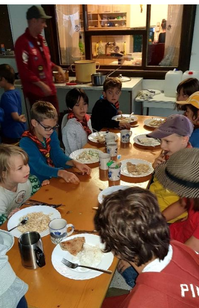
Gleich gibt's Essen!