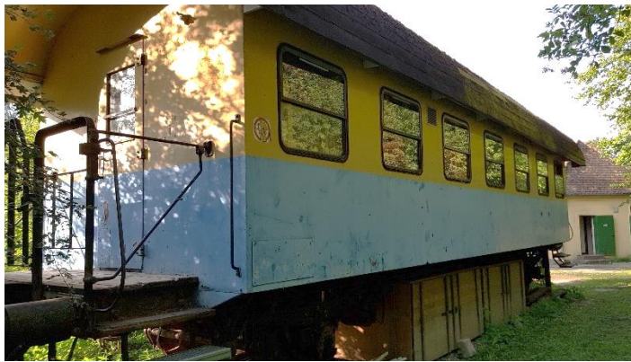
WiWö Schlafplatz! Der beliebte Waggon