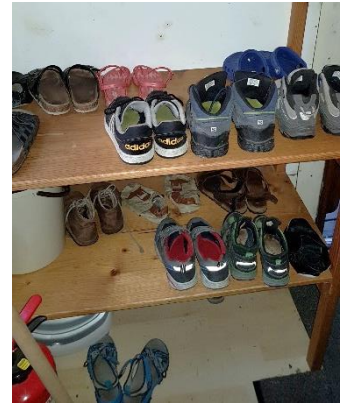
WiWö Ordnung – Zufall ??