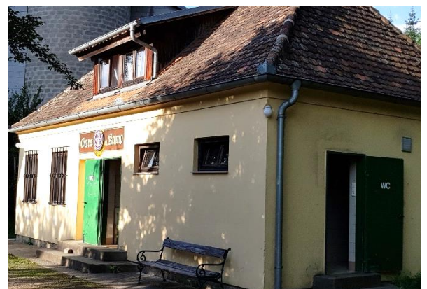
Ein toller Lagerplatz – wir kommen gerne wieder!