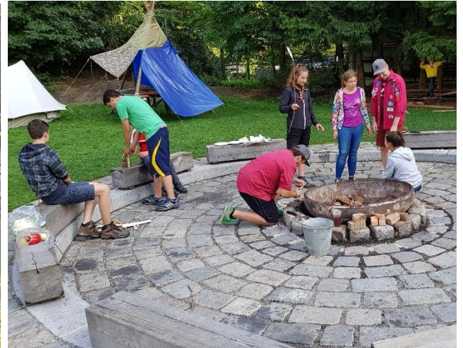
Lagerplatzansichten – im Hintergrund der Neubau des Garser Pfadfinderheimes.